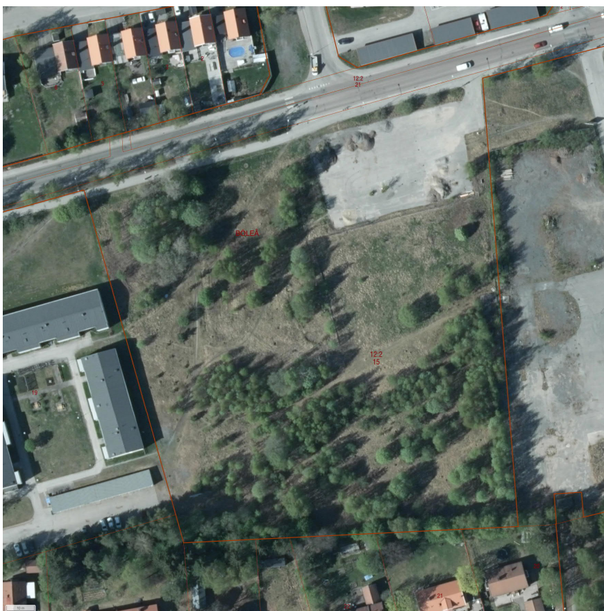
Figur 2. Ortofoto över fastigheten Böleå 12:2.

Detaljplanen syftar till att möjliggöra flerbostadshus om 4–5 våningar där bottenvåningarna kan nyttjas till centrumverksamhet samt ett område för förskola. Boendeparkering är planerat att lösas via underjordiska parkeringsgarage, och därför är ingen större yta för parkering avsatt i planförslaget. En lokalgata som avslutas med vändplan leder in i området och möjliggör anslutning till både bostäder och förskola. Område för förskola och bostäder har i detta skede inte specificerat andel hårdgjord yta och beräknas utifrån schabloner. Figur 3 redovisar markanvändningen i detaljplanen och Tabell 1 redovisar en sammanställning av markanvändningen före och efter planerad exploatering.