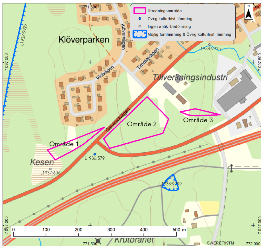
Fig. 1. Översiktskarta över utredningens delområden.

Utredningsområdet utgjordes av tre delområden, med delområde 1 längst i väster och delområde 3 längst i öster. I förfrågningsunderlaget 2022-04-21 ingick endast delområde 2 och 3, utredningsområdet kompletterades av Länsstyrelsen 2022-06-20 med delområde 1 (Fig. 1).