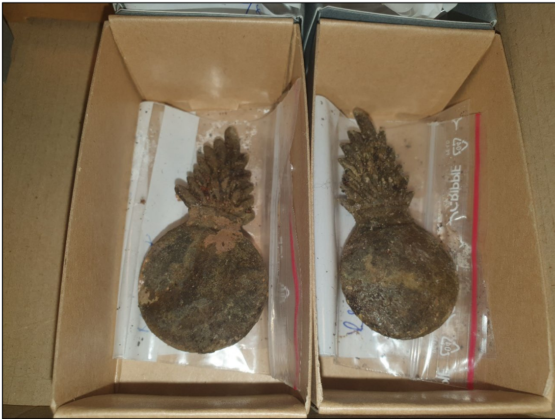
Fig. 3. Två av de fyra näst intill identiska emblemen.