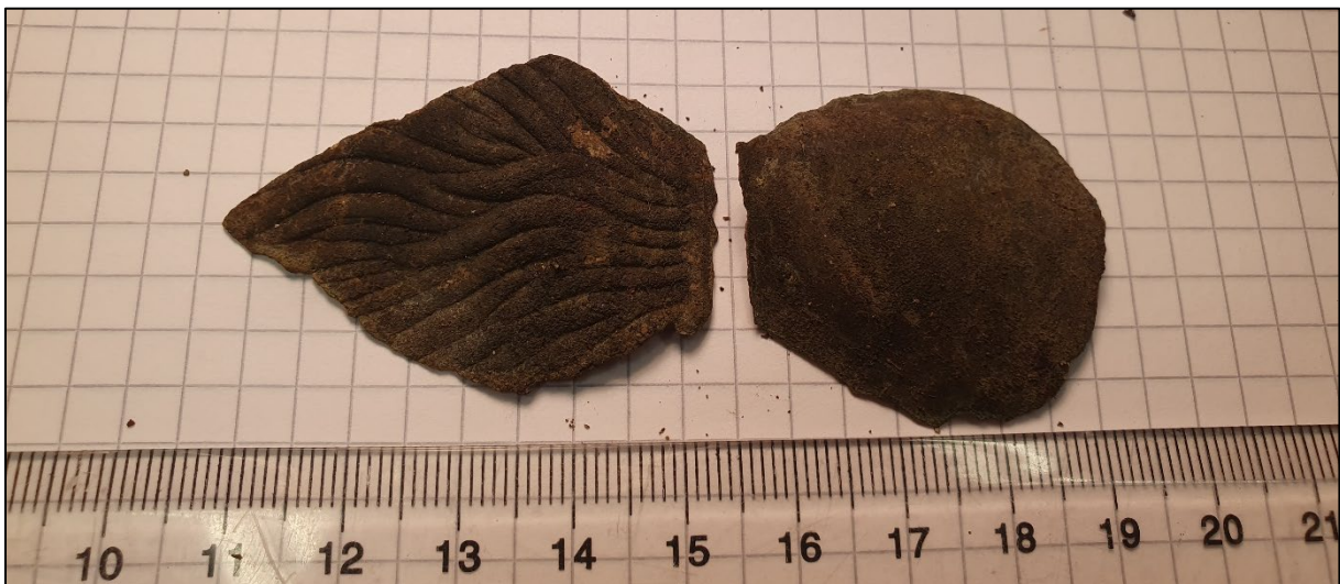
Fig. 4. Ett emblem av tunn mässings(?)plåt.