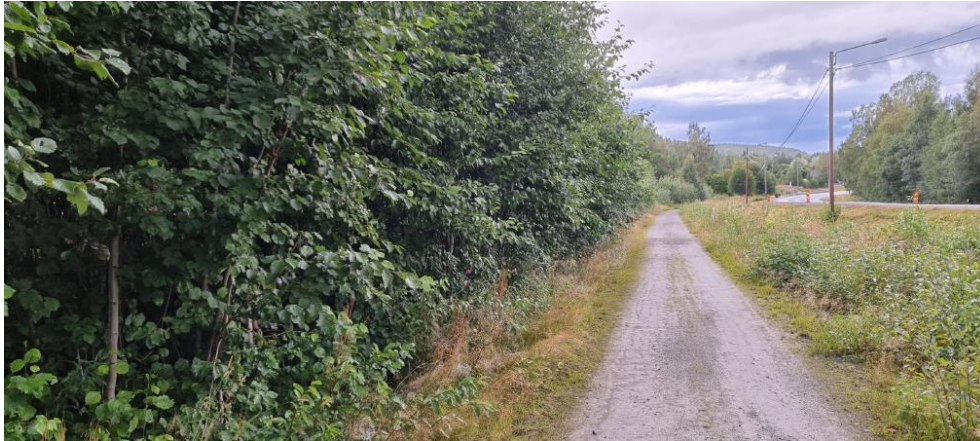
Vy längs med gc-bana mot fastighet med Taveljön till höger