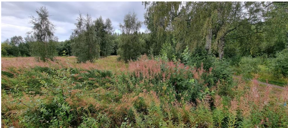
Vy mot fastigheten sett från väg 363/Taveljön.

Tyvärr så är detta inte första gången som fastigheter som Umeå köpt in för kommande satsningar ofta lämnas vind för våg, ofta i åtskilliga år. Både i tätorten, men också på landsbygden. Det kan inte vara acceptabelt att de fastigheter som Umeå kommun äger är de som ser sämst ut, även om de befinner sig i ett "vänteläge" så måste de ju skötas så att inte närboende och besökare drabbas negativt. Vill man sedan arbeta med att utveckla bygden exempelvis genom en satsning på besöksnäringen så känns ju denna typ av passivt agerande väldigt nonchalant!