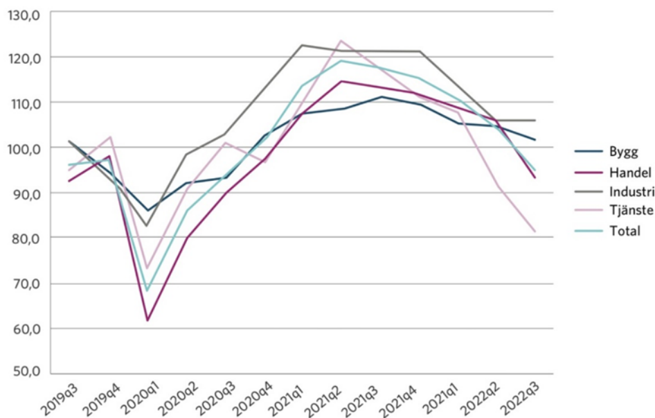
Figur 1. Konfidensindikatorn för näringslivet i Västerbotten har försvagats under 2022 i linje med övriga län och riket. Konfidensindikatorn tas fram genom en företagsenkät och mäter nuläget i näringslivet samt hur företagen ser på den närmaste framtiden (källa Norrlandsfondens konjunkturbarometer nov 2022)

Umeås näringsliv karaktäriseras av en väldigt stor branschbredd och en diversifiering med en tredjedel anställda inom tillverkande industri, företagstjänster samt platstjänster. Det har tidigare inneburit att Umeå klarat konjunktursvängningar betydligt bättre än de flesta andra platser. Till det kommer också det stora inslaget av offentliga arbetstillfällen som är mindre känsliga för skiftningar i konjunkturen.