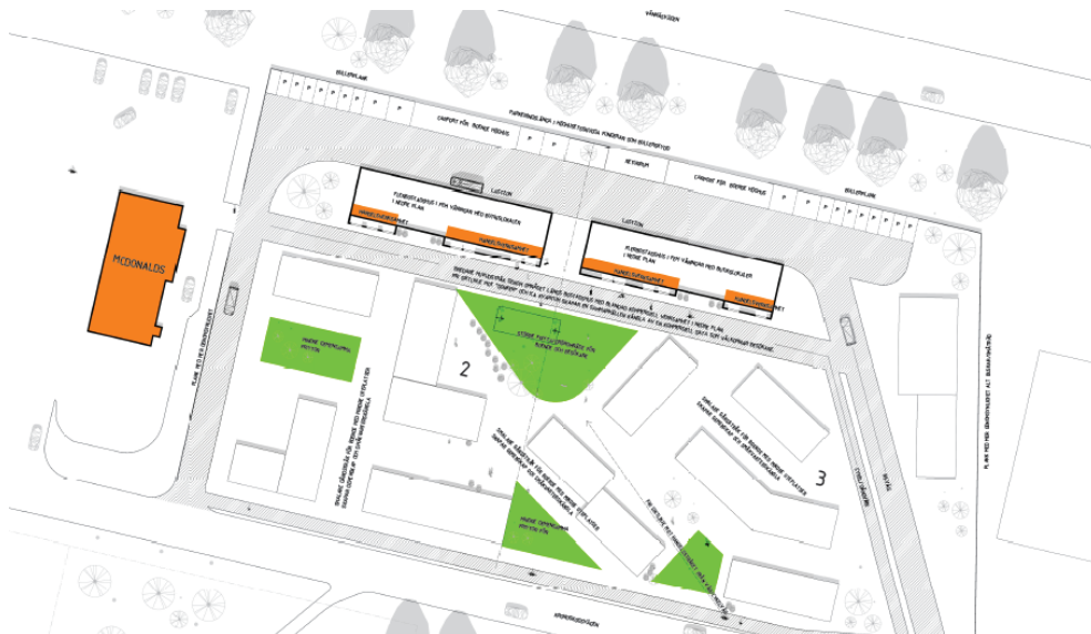
Figur 2. Inlämnad ansökan avser två större flerbostadshus med verksamheter i bottenplan. Norr om bostadskvarteret närmast Vännäsvägen föreslås en långsträckt parkeringslänga som fungerar som bullserskydd. Ansökan gäller även planmässiga

Planansökan gäller omvandling av befintligt industriområde till bostadskvarter med varierande skala och hustypologi. Planansökan gäller även planmässig bekräftelse av den friliggande snabbmatsrestaurang som beviljades bygglov 2021.