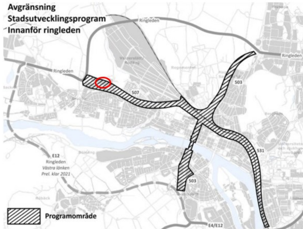
Figur 1. Orienteringsbild med planområdets ungefärliga position inom röd ring.

Planansökan gäller omvandling av befintligt industriområde till bostadskvarter med varierande skala och hustypologi. Planansökan gäller även planmässig bekräftelse av den friliggande snabbmatsrestaurang som beviljades bygglov 2021.