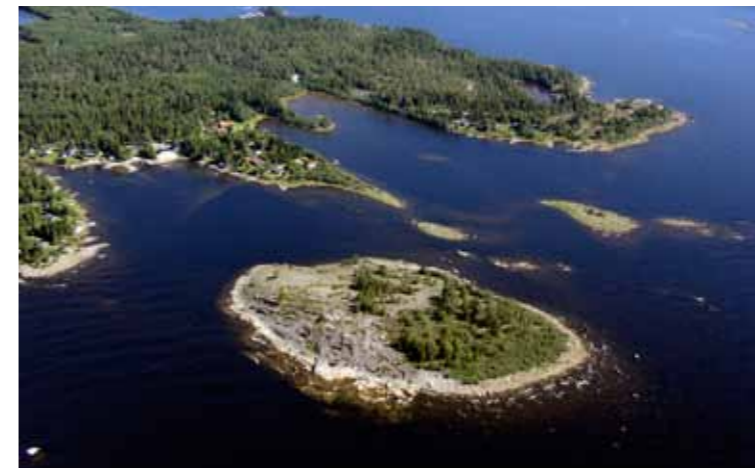
Enahällan, Strömbäck-Konts naturreservat