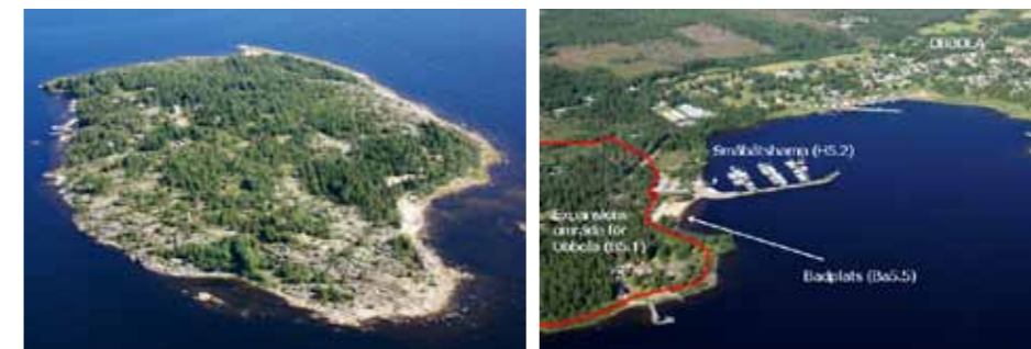
Bredskär utanför Obbola är en stor ö med f.d. lotsstation och bebyggelse med kulturhistoriska värden. På ön finns klippor och badstrand. Ön är lämplig för en försiktig utveckling av besöksnäring