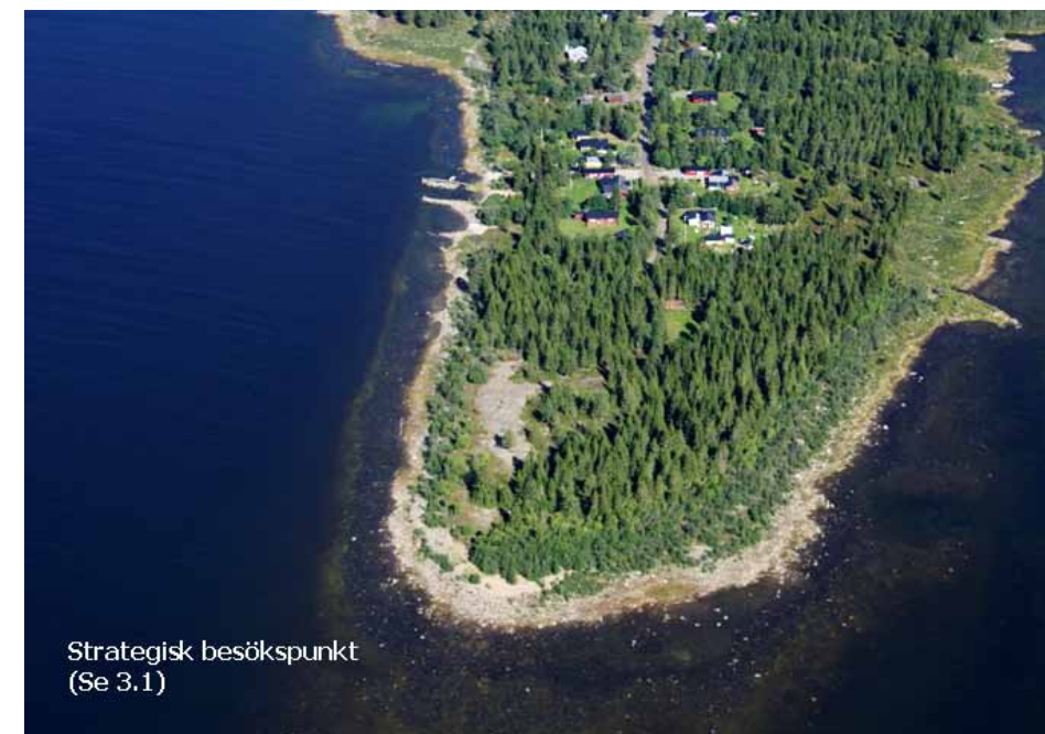
Blågrundsudden söder om Sörmjöle är en av de platser där det finns gott om bebyggelse men där själva udden ändå är tillgänglig. Detta är en plats där det är viktigt att långsiktigt säkerställa allmänhetens tillgång till udden för upplevelser av havet