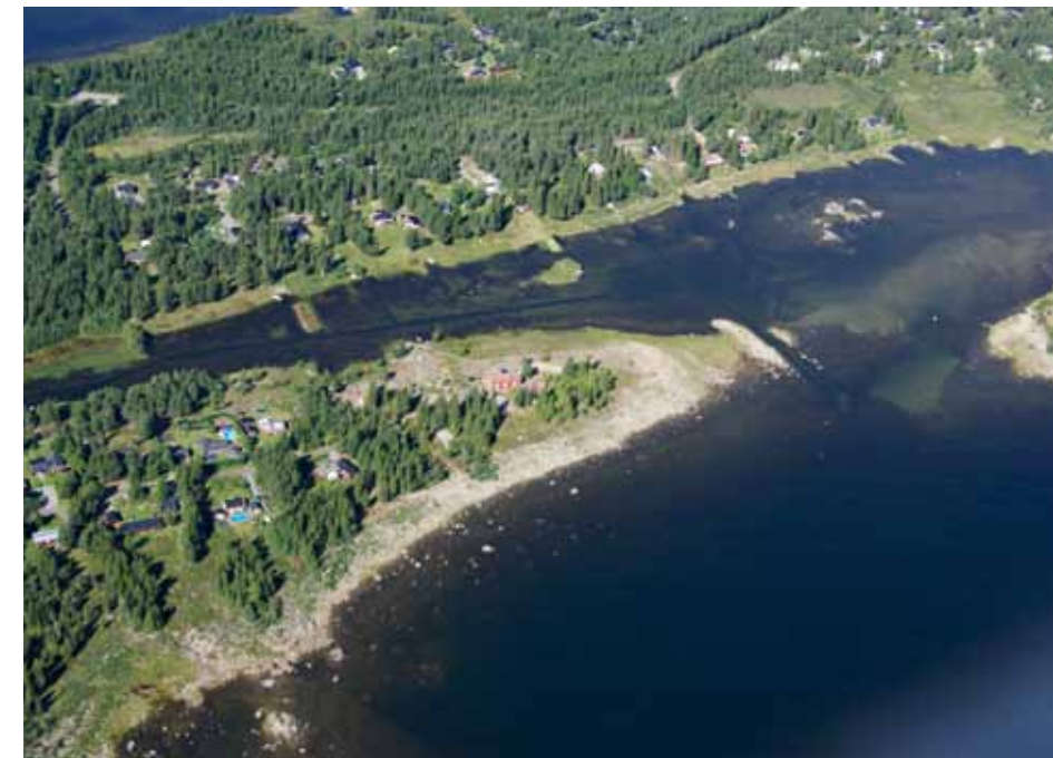
Blågrundsviken är en av de grunda vikarna omgiven av relativt tät bebyggelse. På bilden syns hur landhöjningen skapar problem med båtplatserna. En av de prioriterade planfrågorna i detta delområde är att samordna båtplatserna till gemensamma småbåthamnar.