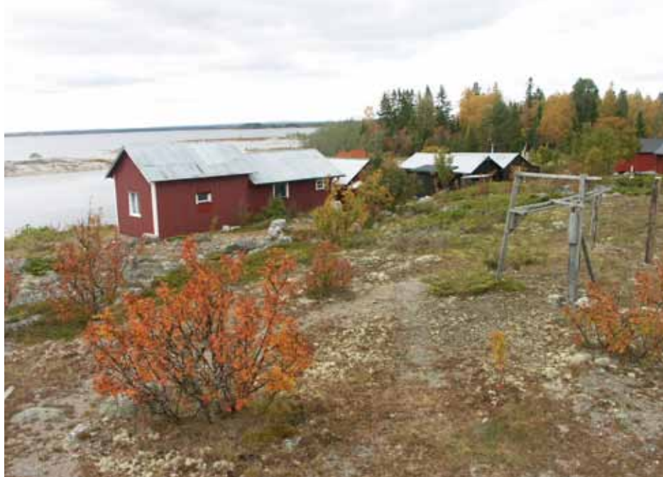
Antrevet är en av de få öarna i delområdet Blågrundsudden. Här finns en skyddad hamn med äldre fiskebebyggelse som har kulturhistoriska värden. Här är det viktigt att skydda kulturmiljön och att tillåta åtgärder som håller öns hedmarker öppna.

Inga områden av riksintresse berör delområdet.